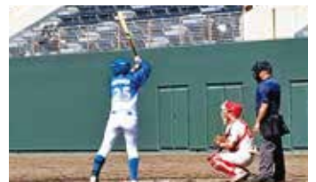
都市対抗野球大会 中九州予選に出場